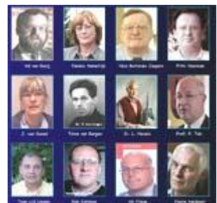
Worden klokkenluiders op de Sociale Databank Nederland ( SDNL ) weggezet als terroristen?