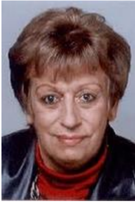
Geachte Mevrouw Videler;

Vanuit betrouwbare bronnen heb ik begrepen dat u vanaf media 2010 nauw bent gaan samenwerken met Truus Tulp en de volgende "eerst schietende en dan pas pratende advocaat Eric Kuijpers "