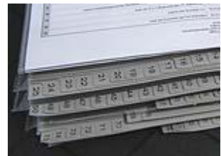
De 12 centimeter dikke aanklacht.