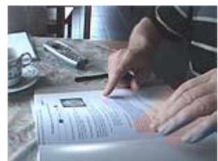
Thuis bij dhr. van Rooij zijn alle stukken onderzocht.